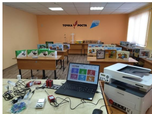
кабинет химии и биологии